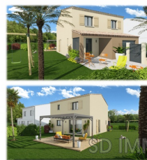
MAISON INDIVIDUELLE À ÉTAGE AVEC UN GARAGE - 91,13 m 2 SAINT-ESTÈVE-JANSON